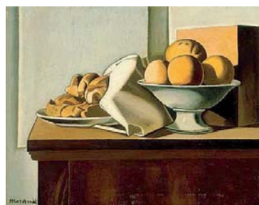
Natura morta Un dipinto di Giorgio Morandi

È sempre stato così? Durante i razionamenti bellici, quando c'era poco da mangiare, la farina di grano veniva arricchita con polvere di marmo, per aumentare il peso — e gli ignari milanesi si ritrovavano un boom di calcolosi nell'immediato dopoguerra. Non so se sia accaduto altrove, ma a Milano il pane in tempo di conflitto mondiale era davvero fatto di pietra. E