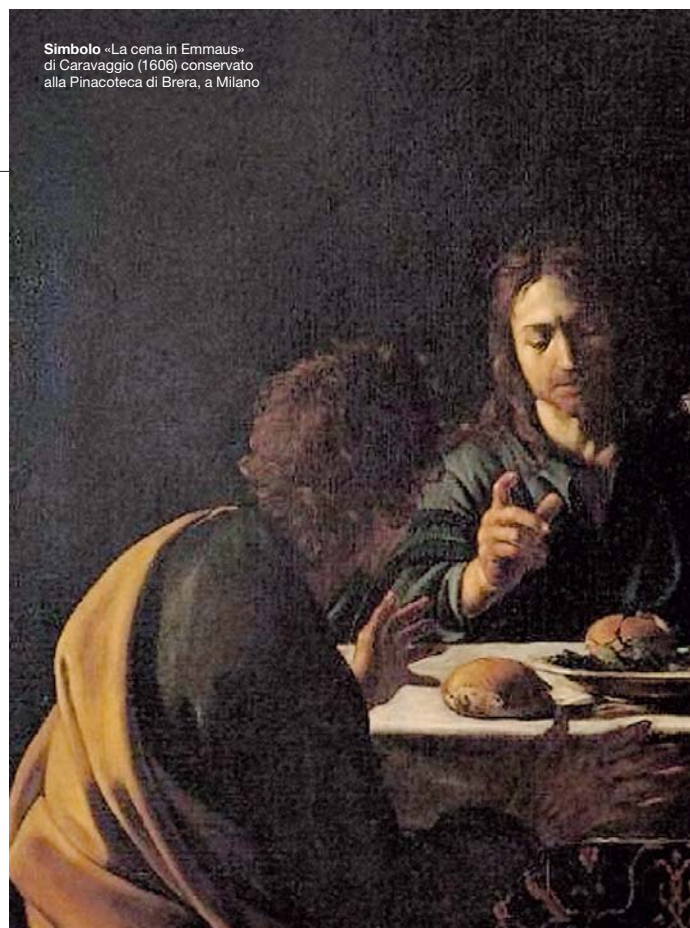
Simbolo «La cena in Emmaus» di Caravaggio (1606) conservato alla Pinacoteca di Brera, a Milano

La liberalizzazione degli orari di produzione e di vendita ha reso il pane multietnico: a Milano i panificatori stranieri sono il 15%