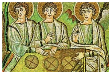
Il mosaico L'ospitalità di Abramo (San Vitale, Ravenna)

Nella scrittura sacra la manna si chiama pane dei cieli. Si legge la sua apparizione nel